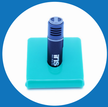
1x Groene microfoon in een houder