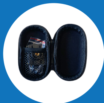
2x Tasje met reserve onderdelen voor het statief en extra klittenband bevestiging