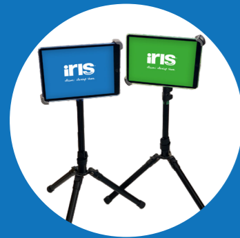
1x Blauwe tablet met statief 1x Groene tablet met statief Beide met klittenband bevestigd