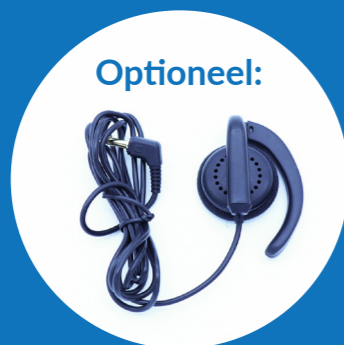
1x Coaching oortje Alleen gebruiken i.c.m. met de Go Live functie