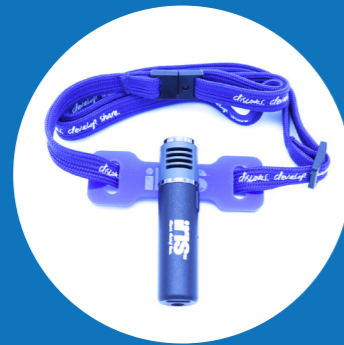
1x Blauwe microfoon met keycord