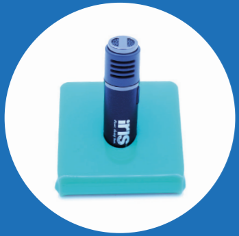
1x Groene microfoon in een houder