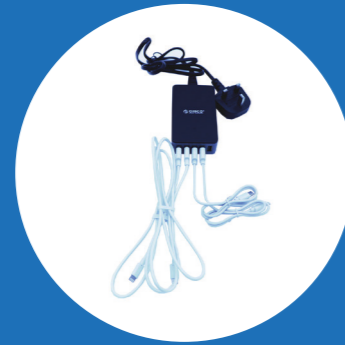
1x USB oplaadstation met oplaadkabels