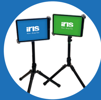
1x Blauwe tablet met statief 1x Groene tablet met statief Beide met klittenband bevestigd