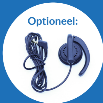
1x Coaching oortje Alleen gebruiken i.c.m. met de Go Live functie