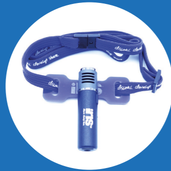
1x Blauwe microfoon met keycord