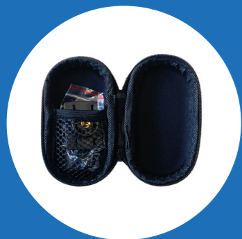
2x Tasje met reserve onderdelen voor het statief en extra klittenband bevestiging